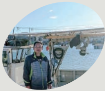
知明水産 Fresh Fish

駒ヶ林でしらす漁、いかなご漁を中心に行っている漁師さん。今回はしらす丼を提供します!