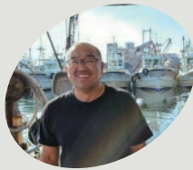
岩松水産 Fresh Fish

駒ヶ林でしらす漁、刺し網漁等をしている漁師さん。鯛、スズキ等。上干ちりめんじゃこの升売り等を予定!