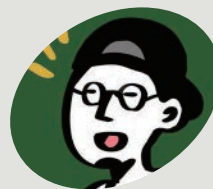
八百屋 mocchi Greengrocer

新長田駅前にある酒屋さん。日本酒を多く取り揃え、夕方からは角打ちも。クラブビールやワインも豊富。