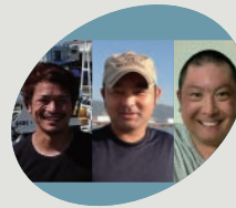
底曳き会 Fresh Fish